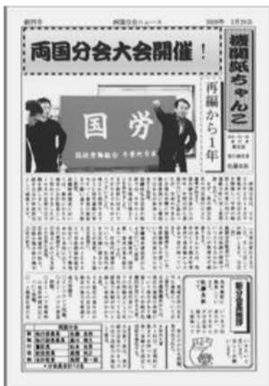
「機関紙ちゃんこ」創刊号

再編後一年が経った両国分会は、定期大会を2月14日に開催した。その中で、毎月第2金曜日に非番者集会を開催するなど新たな活 動を決定し運動してきている。 しかし、せっかく非番者集会に集まっても「言う人」と「聞く人」に分かれてしまう。出