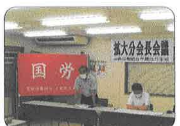
7月4日、エルダー対策会議、7月21日、拡大分会長会議を開催