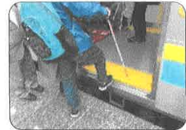
3月28日、障がい者の団体とワンマン運転の実態調査を実施。