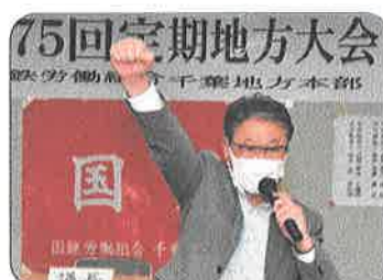
10月16日、第75回定期地方大会を開催新たな方針と新執行委員体制を決める。