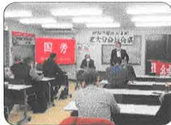
1月14日、地本会議室にて拡大地方委員会を開催