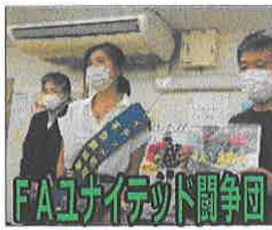
FAUユニテッド闘争団

生きていく上で一番難 しいのは、諦めないこ とです。この社会には びこる不合理をわずか ながらも改善してゆ くために、共に頑張り ましょう。