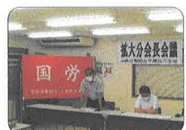
7月4日、エルダー対策会議、7月21日、拡大分会長会議を開催