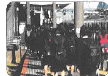
4月26日、鹿島線のワンマン運転を分会組合員と視察。