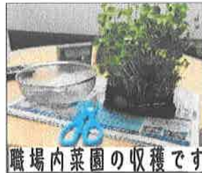
職場内菜園の収穫です

エルダー再雇用で都 賀駅に来て3年になり ます。 私が駅に来た当時は 私を入れて8人いた職 場が今は6人です。 内訳は、エルダー出 向者が一人、本体から の出向者が三人、プロ パー社員が二人です。