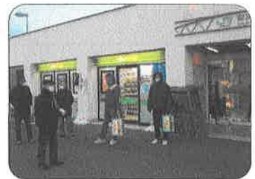
ワンマン運転拡大に抗し、館山駅・安房鴨川駅にて宣伝行動を開催