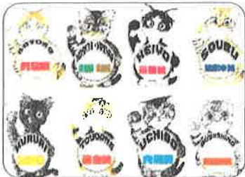
国労ちば3月1日号より「闘うネコ伝説」連載開始