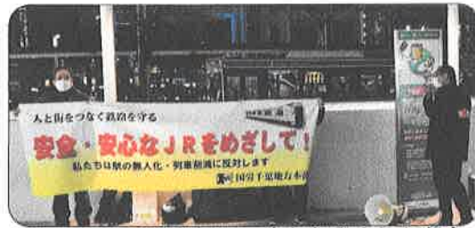
2月16日、千葉駅頭にて宣伝行動を取り組む。ダイヤ改正での安全・サービスの切り捨てを訴えた。