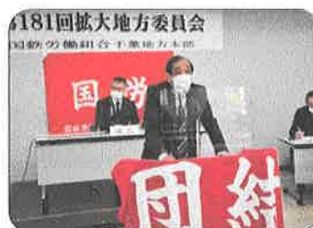
2月27日、緊急事態宣言発出中、感染防止策を取り第181回拡大地方委員会を開催した。