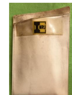
介済みの時計のバンドに貼るウオッチ