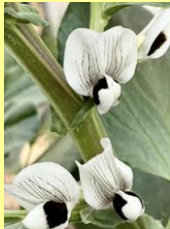
←①ソラマメ 花期は3~4月。収穫は5月頃から