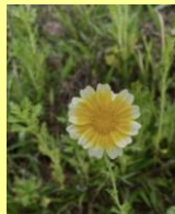
→ ②春菊 キク科の植物で欧米では観賞用。花期は春。